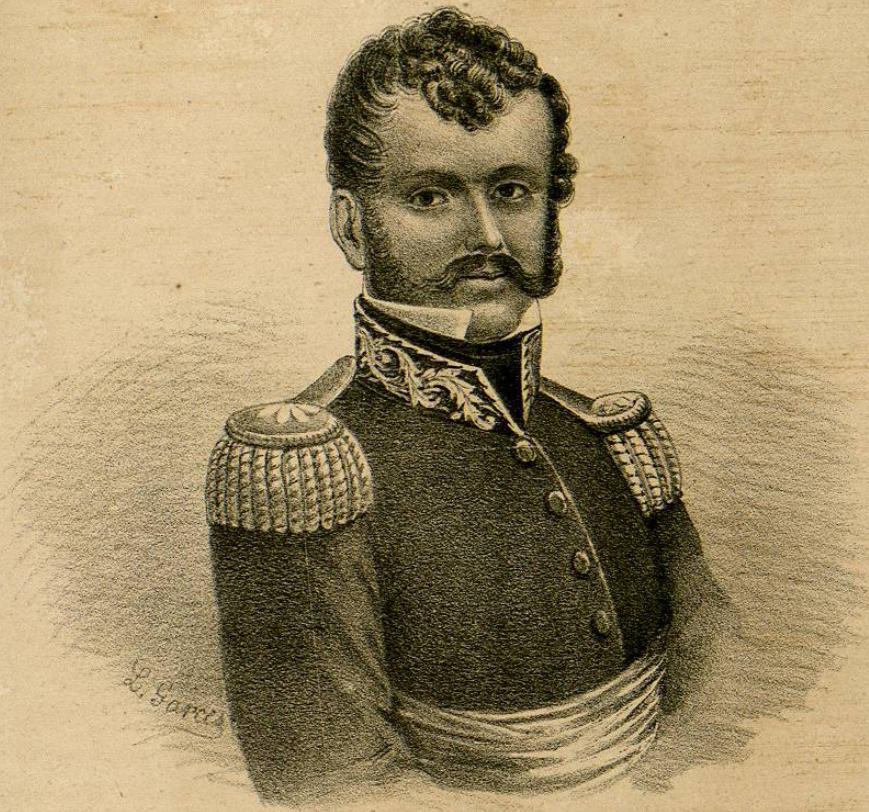
GRAL. D. JOSÉ ANTONIO ECHAVARRRI.

Proclamó el Plan de Casa Mata, que trajo la abolición de la monarquía y sostuvo el principio de que la soberanía reside esencialmente en la Nación, secundando el Acta levantada en Veracruz en 6 de Dbre. de 1822.