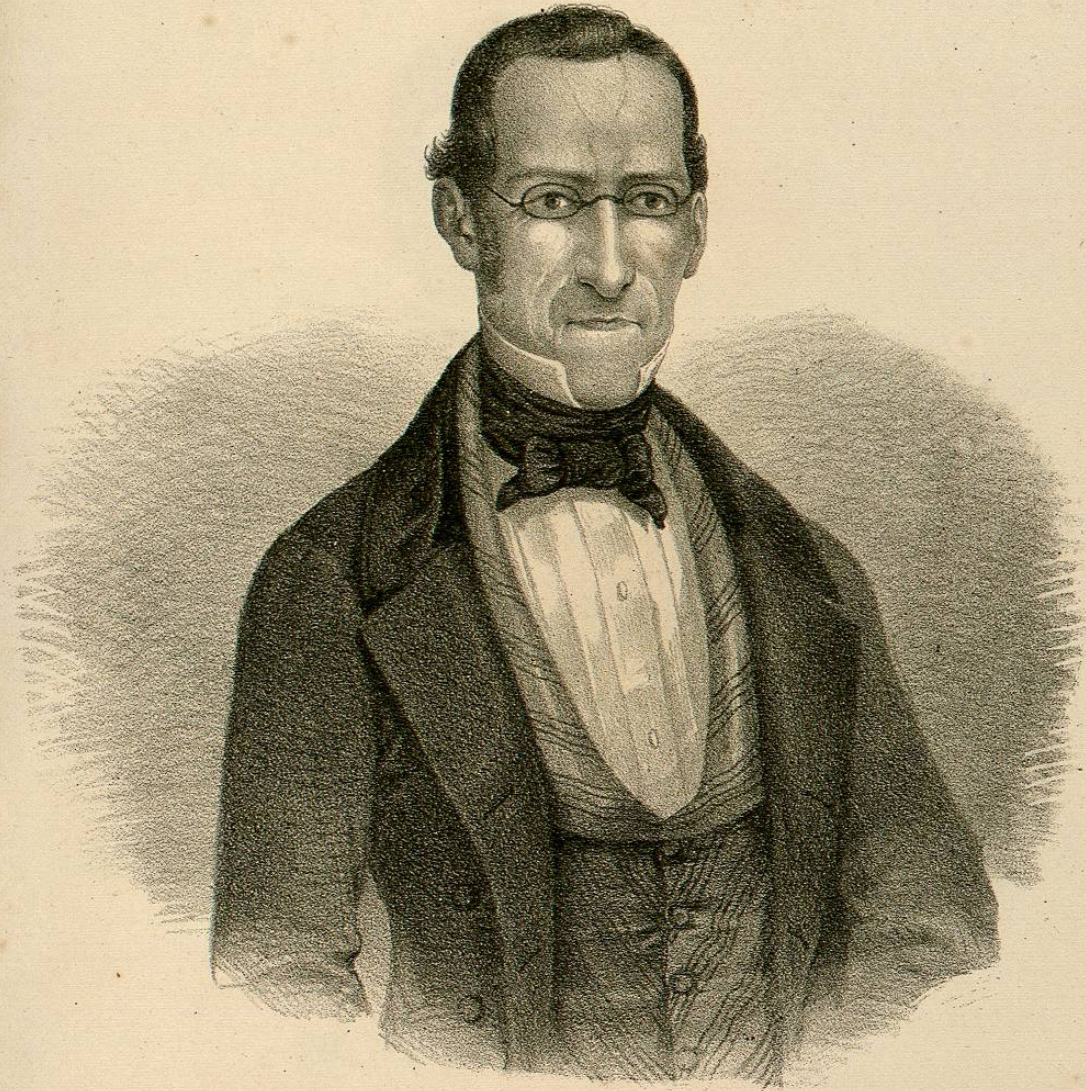
DN FRANCISCO FAGOAGA

Ministro de Relaciones del 30 de Agosto al 24 de Diciembre de 1832.