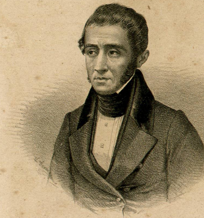
DR LUIS G. CUEVAS.

Ministro de Relaciones en 1837, en 1845 y 49, y de Gobernación en 1840; formó parte de la comisión que concluyó el tratado de Guadalupe Hidalgo.