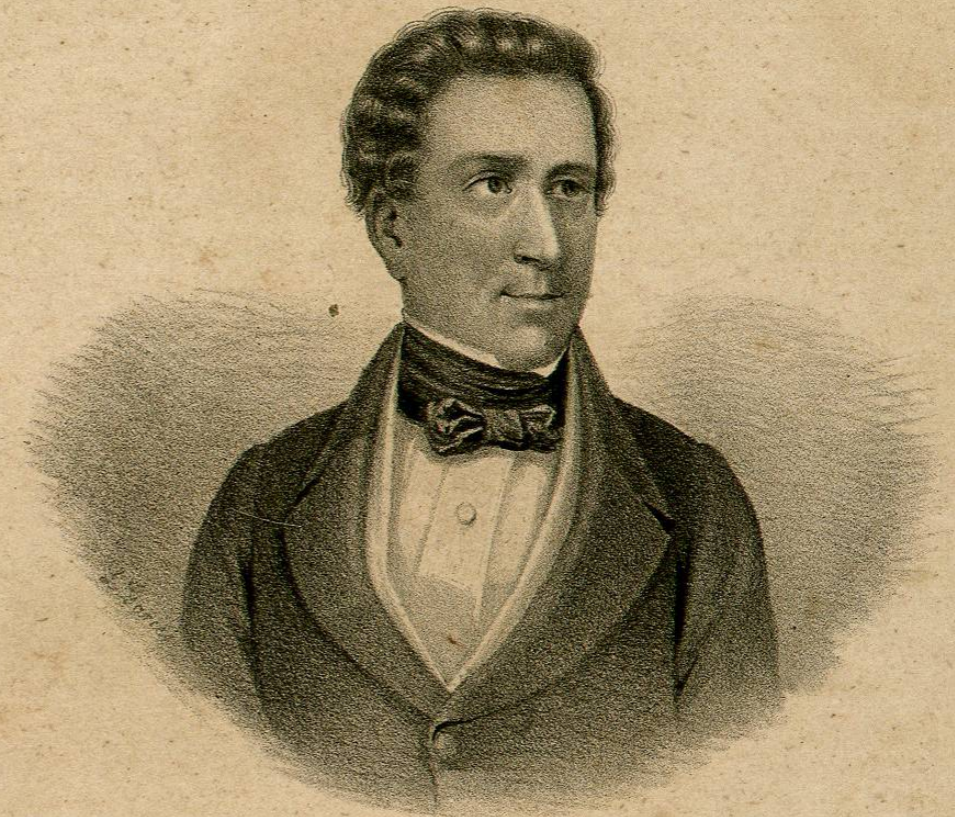
JOSÉ JOAQUÍN PESADO.

Ministro de Relaciones y del Interior en 1838.