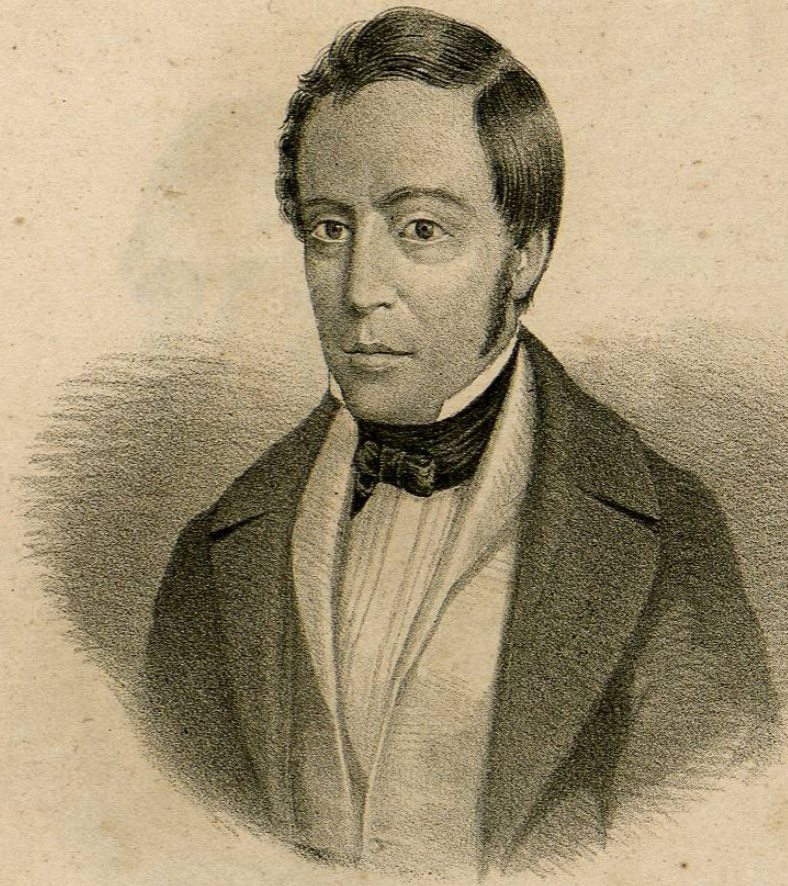
DN LUIS DE LA ROSA.

Ministro de Hac. da de Marzo á Agosto de 1845, de Justicia en Mayo de 1847 y único ministro de Sbre. á Nbre. del mismo año, cuando el gobierno gral. se instaló en Querétaro; quedando en Justicia y Hacienda hasta Enero de 1848. Ocupó el Ministerio de Relaciones y el de Hacienda desde esa época hasta Junio del mismo año. Volvió á ocupar el ministerio de Relaciones en Dbre. de 1855 hasta Agosto del siguiente año.