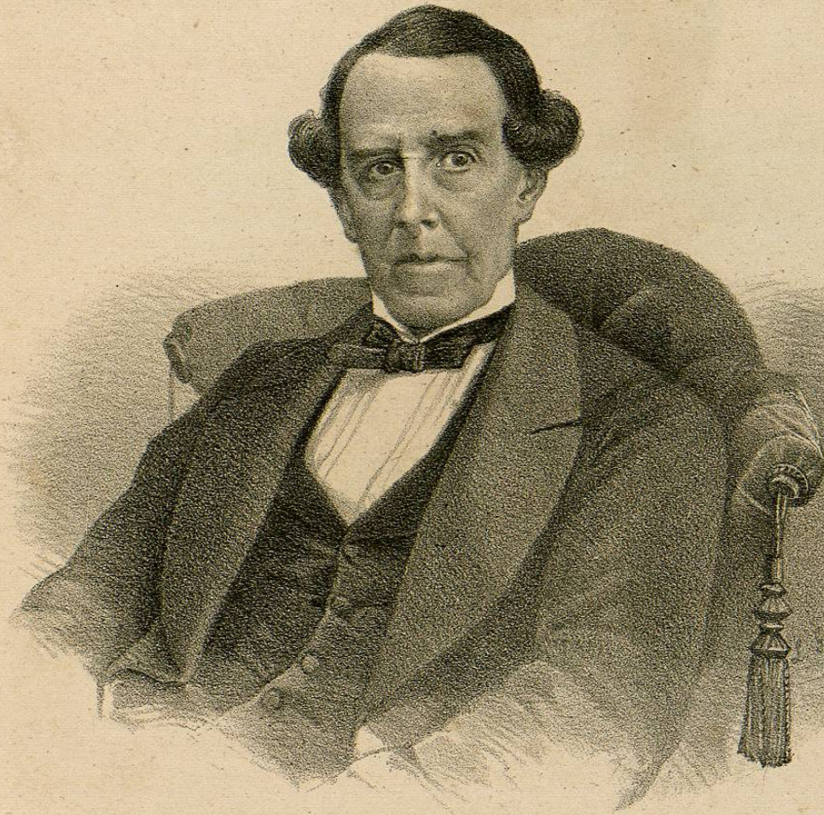
D r MARIANO RIVA PALACIO.

Fuero encargado de la Hacienda en Dbre. de 1844 y de Enero á Marzo del siguiente año, y fué Ministro del mismo ramo de Junio á Agosto de 1848.