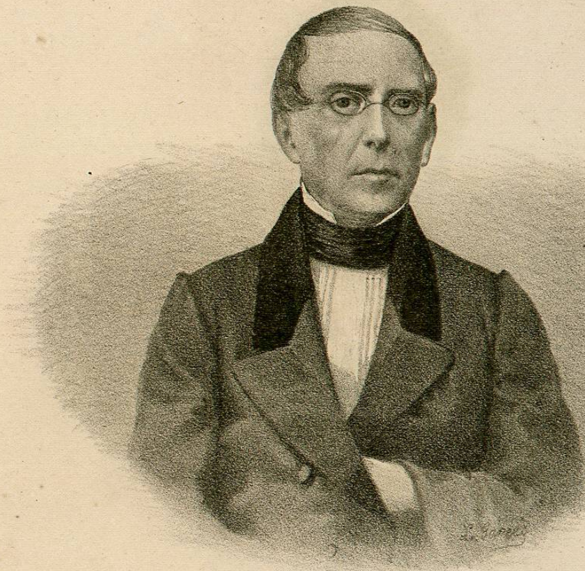
D. TEODOSIO LARES.

Ministro de Justicia de Abril de 1853 á Agosto de 1855.