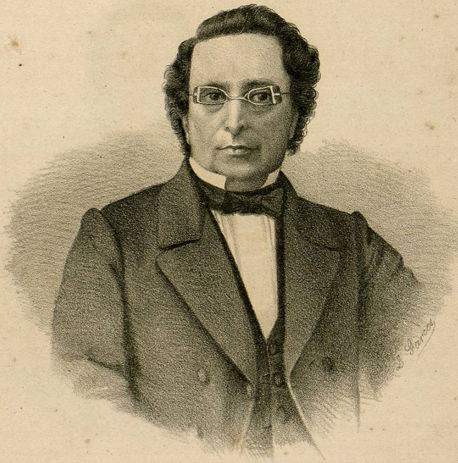
JOSÉ M A LAFRAGUA

Ministro de Relaciones de Oct. á Dbre. de 1846, de Gobernación en Dbre. de 1855 á Enero de 1857. Restaurada la República volvió á ser llamado al ministerio de Relaciones en Junio de 1872, en cuyo puesto permanece aun en 1875