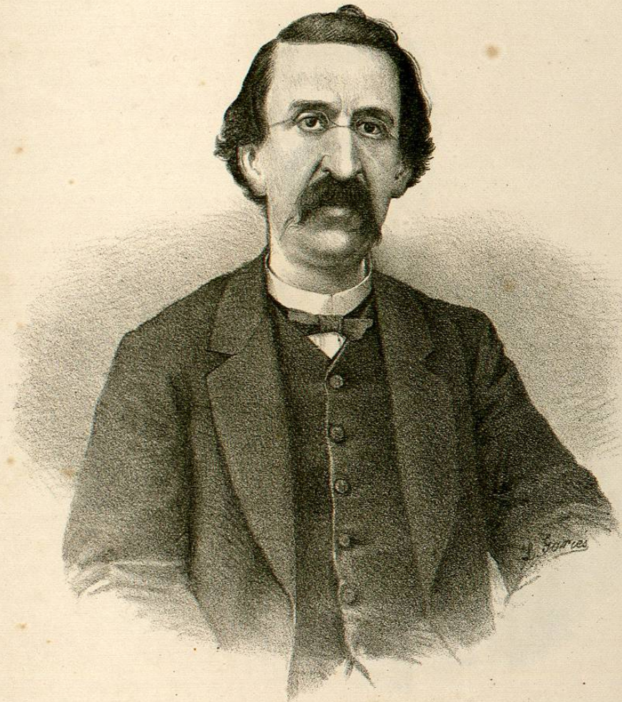
D N FRANCISCO ZARCO.

Ministro de Relaciones en Enero de 1861, y de Gobernacion de Enero á Abril del mismo año.