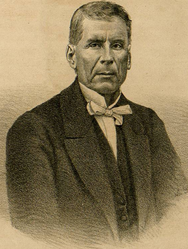
D o SANTIAGO VIDAURRI.

Adherido al Imperio fué Presidente del Consejo de Ministros de Maximiliano y Ministro de Hacienda en Abril de 1867.