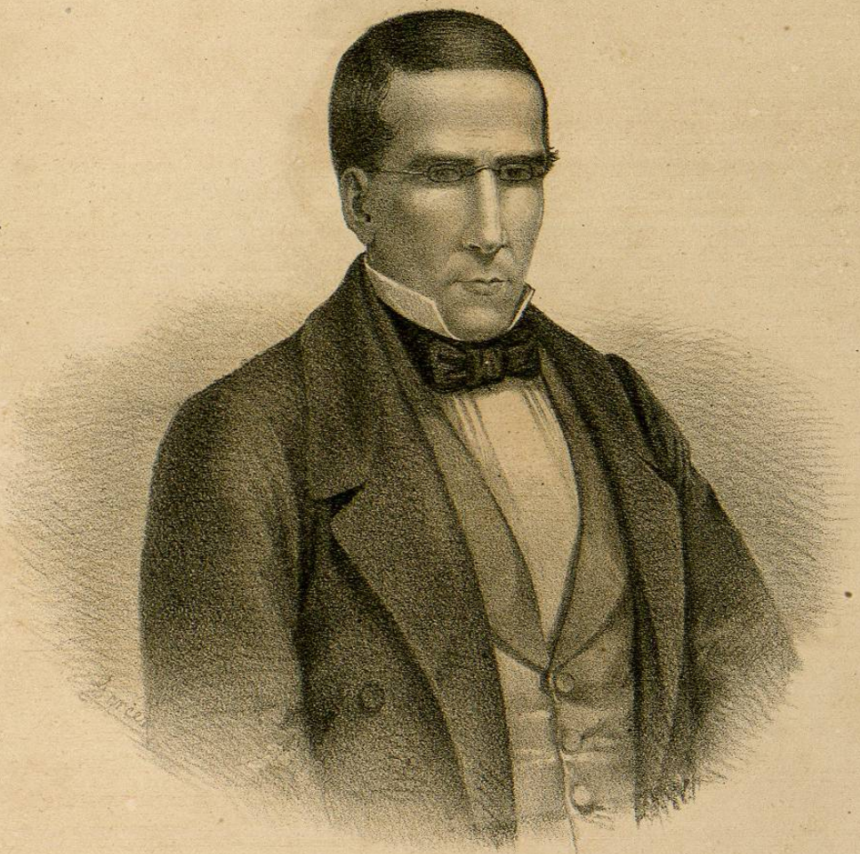
D o SANTOS DEGOLLADO.

Fue Gral. en jefe del ejército liberal de Occidente en 1858, con amplias facultades desde que se embarcó en el Manzanillo el Presidente Benito Juárez.