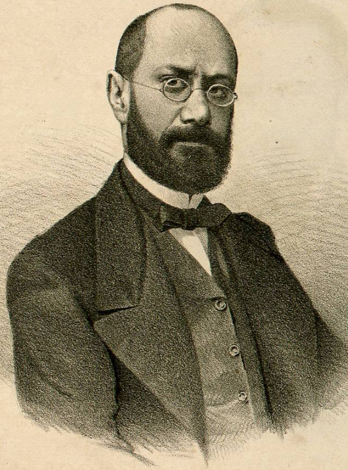
D. o JOSE M. a IGLESIAS.

Ministro de Justicia de Enero á Mayo de 1857, de Hacienda de Mayo á Sept. o del mismo año, y de Gobernacion de Set. o de 1866 á Oct. o del siguiente año. Ocupó el ministerio de Justicia en el largo periodo de Set. o de 1863 hasta Jul. o de 1867 con interrupcion de un mes, y en Oct. o de 1869. tambien despachó el ministerio de Hac. da de Enero á Mayo de 1864.