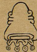
Lám. 42, fig. 39.—M. D. T.

Ixcoyamec se forma del fonético ix de ixco , "en la cara, en la sobre-haz," pupila con párpado rojo, situada en medio del cuerpo del jabalí del país, coyamec , signo figurativo del Dicotyles torquatus , F. Cuv.; la terminacion c no está expresada en el jeroglífico: "en la guarida de los jabalíes."