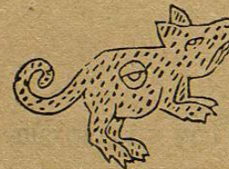
Lám. 53, fig. 9.

tla ó tlán , expresada por dos dientes, completa la palabra Itztlá ó Itztlan , "lugar abundante en obsidiana." Ignoramos qué razones tuvo el Sr. Orozco y Berra para traducir Iztlan , la fig. 1ª de la lám. XV, que el intérprete puso por Molanco , siendo así que es la misma de la fig. 3 de la lám. XII.