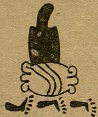
Lam. 50, fig. 7.—M. D. T.

Itzteyocan. —Itz-te-yocan.— Itzteyocan .