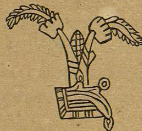
Lám. 41, fig. 8.—M. D. T.

Una cabeza de Ocelotl , tigre, sobre la terminación tepec . El ocelotl parece ser el "Felis Onça," de Lineo.