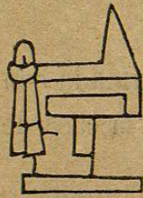
Lám. 21, fig. 8.—M. D. T.

"Tecaxitli, fuente de piedra, compuesta de tetl , y de caxitli , escudilla ó vasija honda: Tecaxi-c, en la fuente."