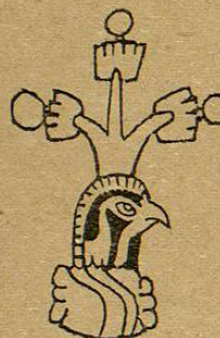
Lám. 50, fig. 2.—M. D. T.

Tzontzapotla. —Tzon-tzapotla.— Teucoltzapotla.