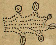
Lám. 31, fig. 2.—Lám. 30, fig. 7.—M. D. T.

“Arenal,” lugar abundante en arena: el signo de ese nombre compuesto de un círculo con puntos y circulitos negros, con dos dientes en medio, que dan la terminacion lla equivale á lla .