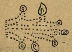
Lám. 28, fig. 4.—Lám. 16, fig. 1.—M. D. T.

Ideográfico: “Lugar de agua arenosa;” expresado por el signo atl , agua, puntuado de negro.