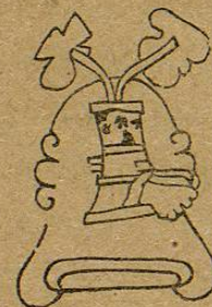
Lam. 43, fig. 4.—M. D. T.

Xoyoltepec. —Xoyolte-pec.— Xocoyoltepec .