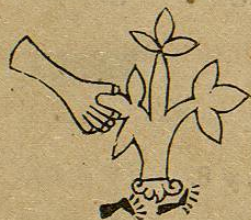
Lám. 31, fig. 6.—M. D. T.

Xometzoyocan. —Xo-metzo-yoca-n.— Xomezocan .