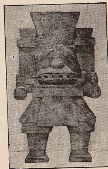
MONOLITO de COATLINCHAN Dibujo del Sr. José M. Velasco.

Quien incurre en falsedad al asegurar que el monolito no tiene un brazo roto, es el Sr. Chavero; y para probarlo, reproduzco la fotografía que presenta al monumento en posición que deja ver, con toda claridad, que tiene el brazo izquierdo roto.