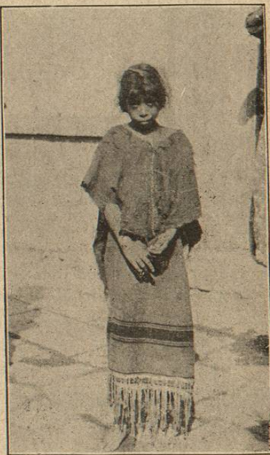
India othomí (actual.)

Sus katunes ó fechas históricas dicen que por el año de 162 de Cristo se desprendieron del Norte de América, con rumbo hacia el Sur, de la casa de Nonoual en la tierra de Tulapán ,