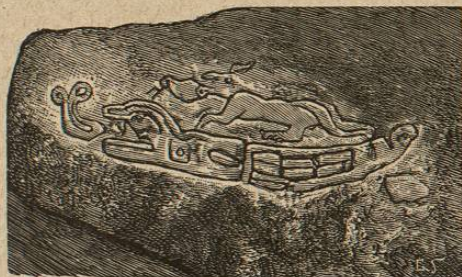
Petroglifo de Huetamo.

Sufriendo el choque de todas las inmigraciones posteriores, su nivel intelectual y aun su