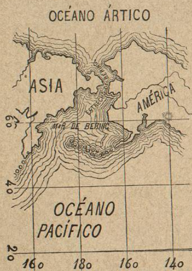
Estrecho de Behring é islas Aleutianas.

Como las inmigraciones al suelo de México, según las tradiciones que hasta nosotros han llegado, vinieron principal-