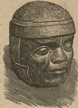
Cabeza colosal de Hueyapán. (Fotografía directa.)

Dejando el extenso é inseguro campo de las conjeturas, algo más concreto y verosímil podemos encontrar volviendo nuestros ojos hacia los othomíes ú Otonca , cuyo nombre gentilicio es Hiá-Hiú . Desde luego su idioma monosilábico, su tipo antropo-