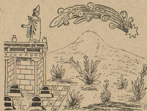
Motecuhzoma observa desde su palacio el cometa de 1516 (según los jeroglíficos de Durán).

Inmediatamente mandó convocar á todos sus astrónomos, agoreros, astrólogos, adivinos, hechiceros y encantadores para que le explicasen el prodigio; pero éstos le contestaron que no lo habían visto, con lo cual montó