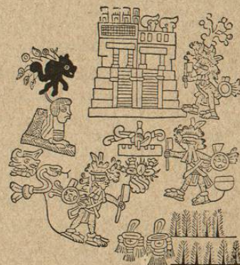
Estreno del teocalli, según el Códice Tellesiano Remensis.