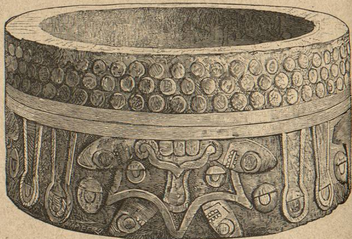
Cuaxicalli de Axayacatl. (Original en el Museo Nacional de México.)

Ordenó este rey también la construcción de la Piedra del