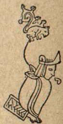
Ahuizotl, según el Códice Mendocino.

Activó la construcción del templo mayor de México comenzado por su antecesor, que al fin se terminó, volviendo á emprender otra guerra para tener suficiente número de