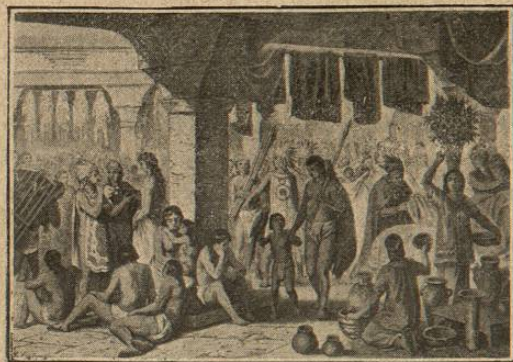
Mercado de Tlaltelolco. (Armin.)

más alta plataforma contemplaron el bello panorama de la