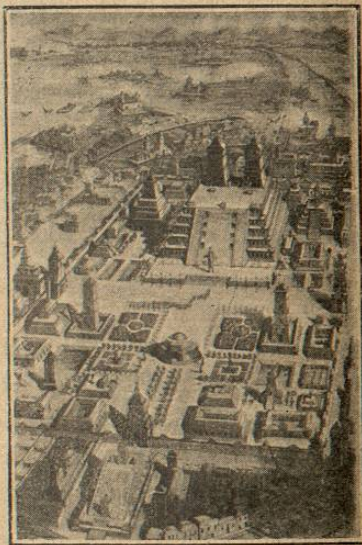
Templo maya de México y sus anexos. (Armin.)

de aquéllos el capitán Juan de Escalante, se trabó un serio combate en que el cacique invasor fué derrotado, costando la victoria la vida de Escalante.