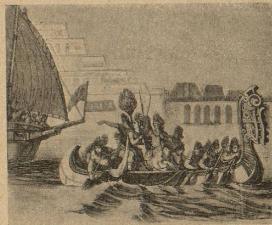
Prisión de Cuauhtémoc.

tres de la tarde; los Méxica se precipitaron por el Oriente y Sur sobre los bergantines, aprovechando Cuauhtemoc aquella última escaramuza para salir en una canoa por la zanja de Santa