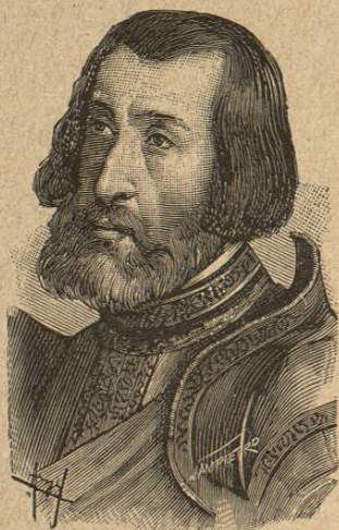
Cortés al terminar la conquista.

El derecho de conquista , admitido en aquellos tiempos, no es más que uno de los grandes errores de la humanidad, puesto que jamás se podrá justificar, ni ante la religión , ni la necesidad de civilización y progreso , el quitar á otro lo que es suyo, ni imponer á la fuerza lo que solamente la persuasión puede alcanzar.