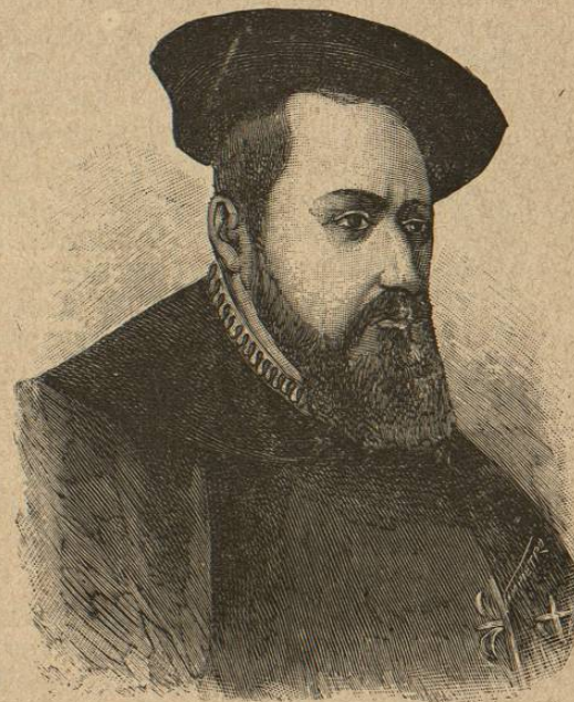
D. Antonio de Mendoza, primer visorrey.

El recuento de los vasallos de D. Hernando y las expediciones para los descubrimientos pusieron en desacuerdo á