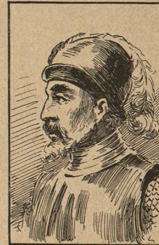
Gonzalo de Sandoval, de Medellín.

Á más de distinciones honrosísimas, se le concedió un título de Don y un escudo de armas, por cédula de 7 de Mayo de 1525. Enfermó gravemente Cortés, y Carlos V luego fué á visitarle á su alojamiento, distinción altísima que mucho estimó D. Hernando. Á las mercedes dichas añadió el Rey, en 1529, el título de MARQUÉS DEL VALLE DE OAXACA, con señorío de 22 villas