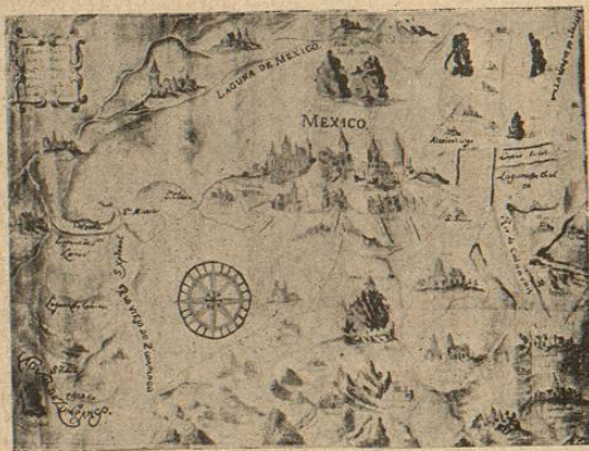
México y sus alrededores en 1618.

Los principales acontecimientos de su gobierno pueden reducirse á esto: vigilar y examinar todo lo correspondiente