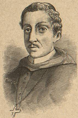
Ilmo. Dr. Juan de Palafox y Mendoza.

Dados estos antecedentes acerca de los dos personajes que en la colonia tenían la autoridad en sus manos, vino á reagravar la situación el haberse declarado la guerra entre Portugal y España el año 1640; y como el Virrey descendiese de familia portuguesa, fácilmente pudo el Sr. Palafox, según dicen algunos escritores, excitar sobre él la desconfianza del Rey de España. Sea lo que fuere de ello, el señor Palafox recibió el nombramiento de virrey, y sin notificarlo prudentemente al Sr. de Escalona, lo depuso el día 10 de Junio de 1642, ejerciendo sobre sus bienes atropellos é injusticias. Después de permanecer el Virrey de-