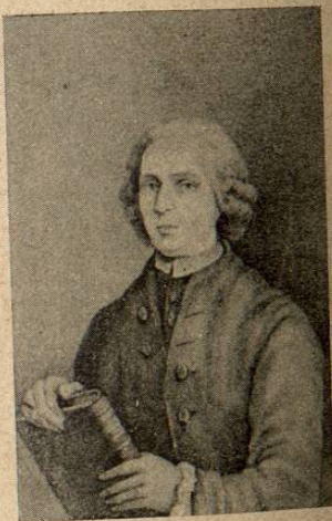
P. Francisco X. Alegre.