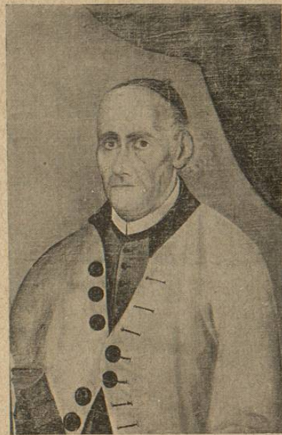
D. José Antonio Alzate y Ramírez.

en tierra extranjera comiendo el pan del destierro.