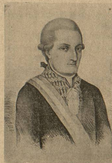
El Conde de Revillagigedo.

Después de activas diligencias y acuciosas investigaciones dictadas por el Virrey, se aprehendió á los criminales, que eran Felipe Aldama, Joaquín Blanco y Baltasar, los tres extranjeros, quienes confesaron su crimen, el modo con que