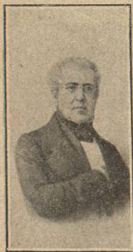
D. Lucas Alamán.

Combinaron Bustamante y su Ministerio el que se le entregara la suma de 50.000 pesos en oro al capitán del buque sardo Colombo , llamado Francisco Picaluga, quien se había comprometido á entregar á Guerrero. Ese traidor infame, abusando de la amistad que tenía con el caudillo del Sur, le invitó á cenar á bordo de su buque, y una vez entretenido en la comida, levó anclas del puerto de Acapulco, y poniendo