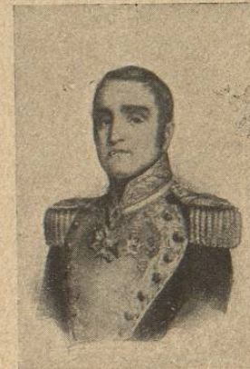
General Anastasio Bustamante.

Entró el general D. ANASTASIO BUSTAMANTE en la capital, investido con el carácter de presidente de la República, el 1.º de Enero de 1830, pidiendo luego al Congreso decretara que la revolución había sido justa y que el presidente Guerrero estaba imposibilitado para gobernar la nación . Era Bustamante hombre de clara inteligencia, corazón duro, severo y honrado y de pasiones vehementísimas.