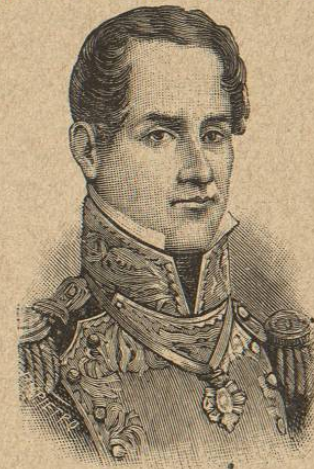
General Antonio López de Santa Ana.

Por segunda vez, si no la opinión unánime de la nación, sí una parte considerable de ella, llevó al supremo mando al general D. ANTONIO LÓPEZ DE SANTA ANA. Esta vez fué cuando mejor dió á conocer Santa Ana su falta absoluta de carácter y opiniones, demostrando sólo su ambición; pues habiendo sido el más acérrimo defensor de la República federativa, fué el primero que la hirió de muerte, comenzando por suprimir la Cámara de Senadores y declarando competente al Congreso para constituir de nuevo la nación.