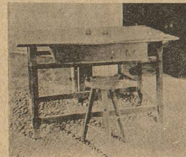
Mesa en que firmó el Sr. Ocampo el codicilo de su testamento.

Márquez pretendió desde luego fusilar al señor Ocampo, mas no condesendió Zuloaga á ello, diciéndole debería someterle á consejo de guerra y entonces se vería lo que conviniera hacer.