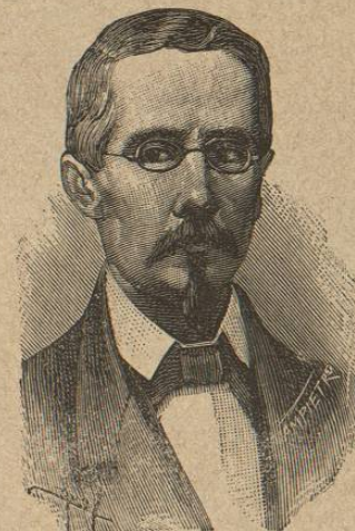
General Santos Degollado.

Salió Degollado, autorizado por el Congreso, á perseguir á los asesinos de Ocampo, y el 16 de dicho mes presentó una batalla en el monte de las Cruces, donde cayó en una celada y fué hecho prisionero y fusilado. Al lado de la figura apacible de Ocampo se yergue la enérgica y arrebatadora de Degollado; poseía éste prendas personales de alta estima y honradez acrisolada, un valor á toda prueba y un patriotismo intachable; su juicio rectísimo y su moderación de carácter, verdaderamente ejemplar, le colocaron en primer término sobre la falange ilustre de los liberales de México.