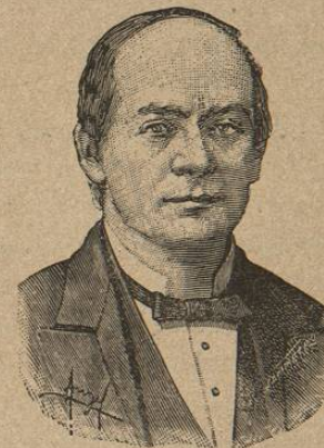
Lic. Sebastián Lerdo de Tejada.

Era Lerdo persona de alta y clara inteligencia, al grado que en buena metáfora se podía admitir lo que sus partidarios decían, y era « que tenía por cerebro un sol »: su elocuencia era avasalladora, su carácter finísimo, sus modales elegantes y distinguidos, poseyendo el arte de ganarse amigos.