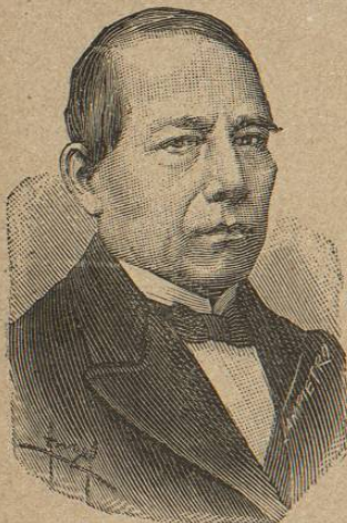
Lic. Benito Juárez, Benemérito de América. (1867.)