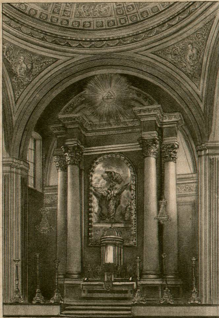
Altar mayor de la iglesia del hospital de la Purísima Concepción y Jesus Nazareno de México.

En la sacristía, techada con un curioso artesonado de cedro que forma diversos casetones, se conserva una mesa de un solo tablon, tambien de cedro, úni-