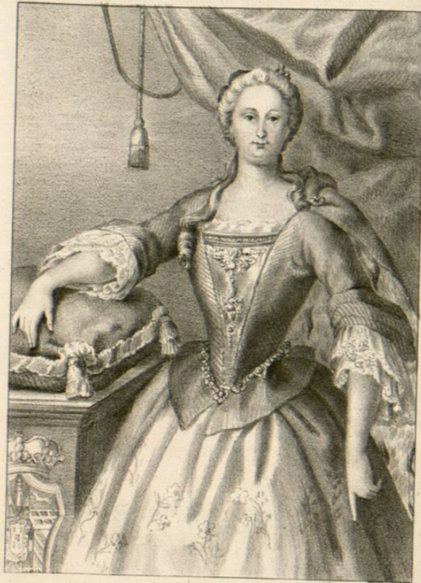
D a ISABEL FARNESIO, reina de España, segunda esposa del rey Felipe V.

que mandaba el ejército francés, conoció casualmente al abate Julio Alberoni, hijo de un pobre jardinero de Placencia en el ducado de Parma, ejercicio en que él mismo pasó sus primeros años. El duque, prendado de su inteligencia y facilidad para el trabajo, lo hizo su secretario y lo llevó consigo á España, cuando fué á tomar el mando de aquellas tropas. Muerto Vandoma, Luis XIV continuó su proteccion á Alberoni, quien supo insinuarse en el favor de la Ursinos, y cuando Felipe resolvió pasar á segundas nupcias, Alberoni persuadió á la Ursinos que la princesa mas adecuada para que ejerciese sobre ella el mismo influjo que sobre la difunta reina, era D a Isabel Farnesio, sobrina del duque de Parma, de quien Alberoni era enviado en Madrid. Decidido el casamiento y mandados al duque de Parma los poderes para recibir la mano de su sobrina en nombre de Felipe, la Ursinos tuvo noticia de que el carácter de Isabel era muy diverso del genio dócil y sumiso que Alberoni le habia atribuido: pero aunque con tal aviso se hizo partir un correo para interrumpir la celebracion del matrimonio, se retardó artificialmente á su llegada á Parma la entrega de los despachos, que no recibió el duque hasta despues de terminada la ceremonia nupcial. La nueva reina se puso en marcha inmediatamente para España: á su paso por S. Juan de Pie del Puerto, en la frontera de Francia, en donde se detuvo dos dias, tuvo largas conversaciones con