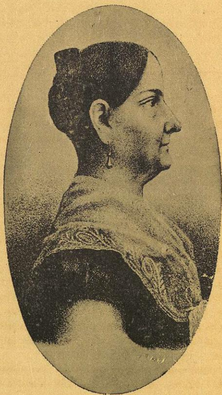
Da. Josefa Ortiz de Domínguez.