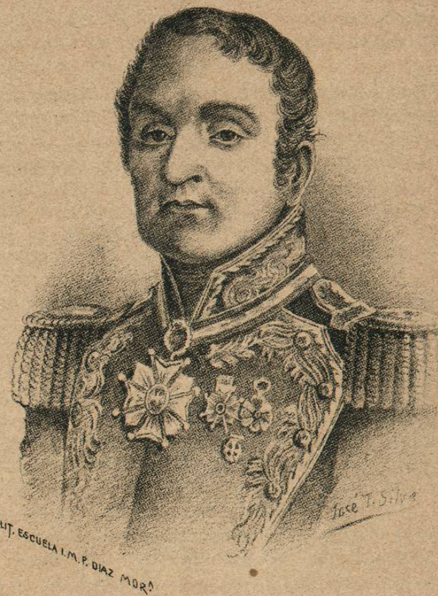
Gral. Anastasio Bustamante

En otra parte dice el mismo Señor Arróniz "Fijó su residencia en San Miguel Allende, y ya muy quebrantado en salud, espiró el 6 de Febrero de 1853, y fué enterrado su cuerpo en la parroquia, haciéndose á su memoria unas magnificas exequias. El Supremo Go