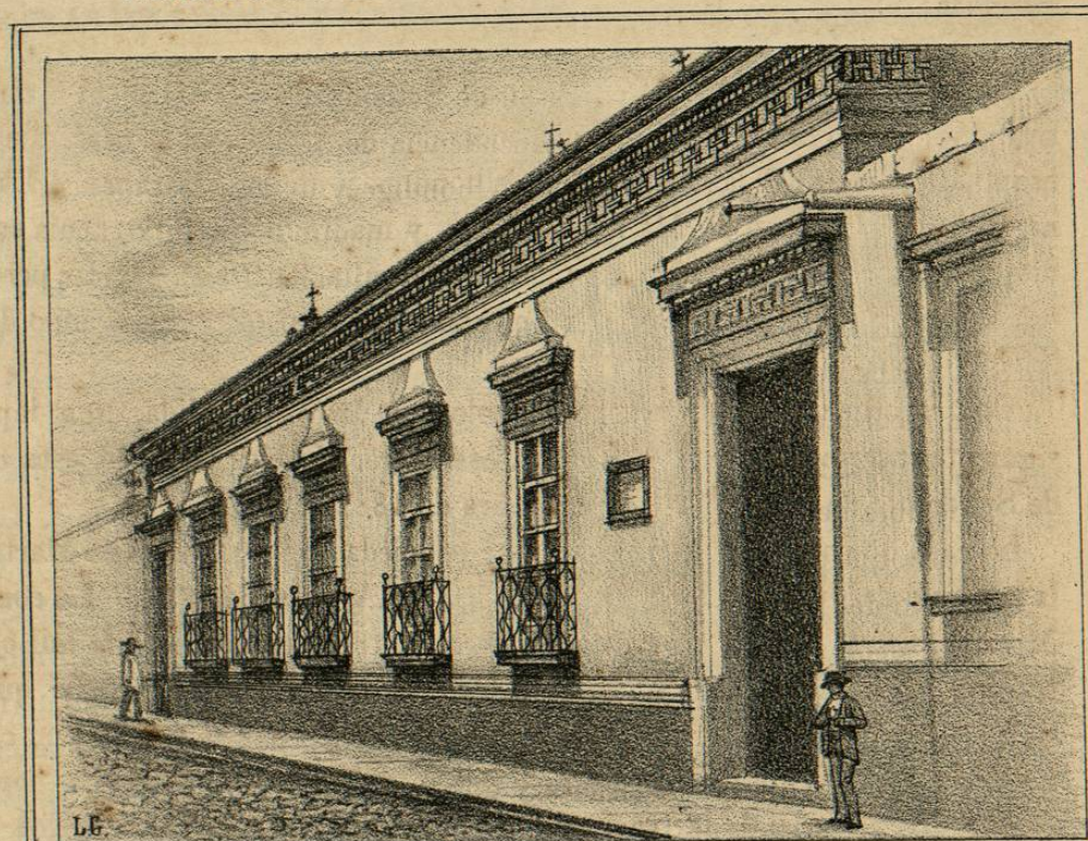
Casa donde nació el Emperador D. o Agustín Iturbide.—Vista sacada el año de 1884. (Morelia.)

Quando estaba Morelos en las cárceles de la Inquisicion, en México, despues