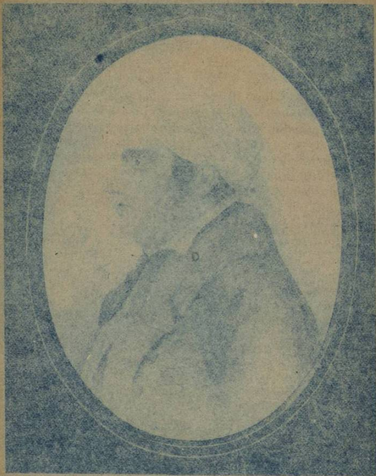
RETRATO DEL SR. MORELOS COMO ESTABA EN LA PRISION DE LA CIUDAD DE VALLADOLID

En puntual cumplimiento de las sabias y piadosas disposiciones del Exmo Sor. Capitan General de la Nación Americana Dr. D. Miguel Hidalgo y Costilla, de que debe esta rendirle las mas expresivas gracias por tan Singulares Beneficios, prevengo á todos los Dueños de Esclavos y Esclavas, que luego inmediatamente que llegue a su noticia esta plausible Superior Orden, los pongan en libertad, otorgandoles las necesarias Escrituras de atalavoria con las inserciones acostumbradas para que puedan tratar y contratar, comparecer en Juicio, otorgar Testamentos, Codicilos y ejecutar las demás cosas que e-