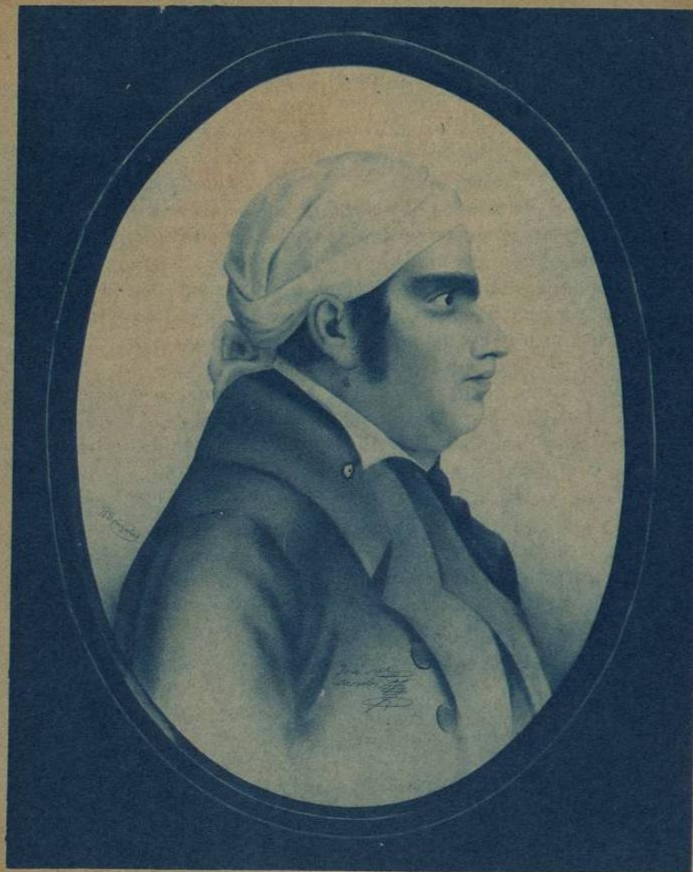
RETRATO DEL SR. MORELOS, COMO ESTABA EN SU PRISIÓN DE LA CIUDADELA.