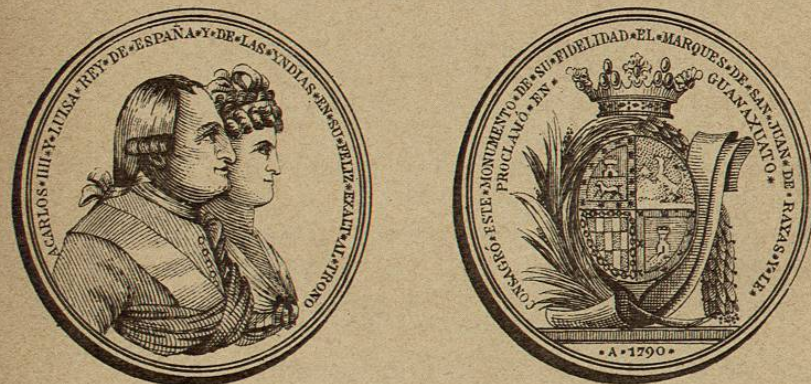
Acuñada por la Ciudad.