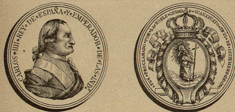
Medallas arrojadas al pueblo en las solemnes fiestas con que Guanajuato celebró la coronacion del Rey Carlos IV en 1790

y representa en su anverso el busto del Rey perfectamente bien gravado, con esta inscripcion "Carlos III Rey de España y Emperador de las Indias;" y en su reverso tiene las armas de Guanajuato, es decir, la estatua de la Fé sobre unas montañas, en el centro de un escudo caprichosa y elegantemente formado, que remata con la corona imperial; en torno de él se lee lo siguiente: "Fué proclamado por la noble ciudad de Guanajuato en 25 de Diziembre de 1790."