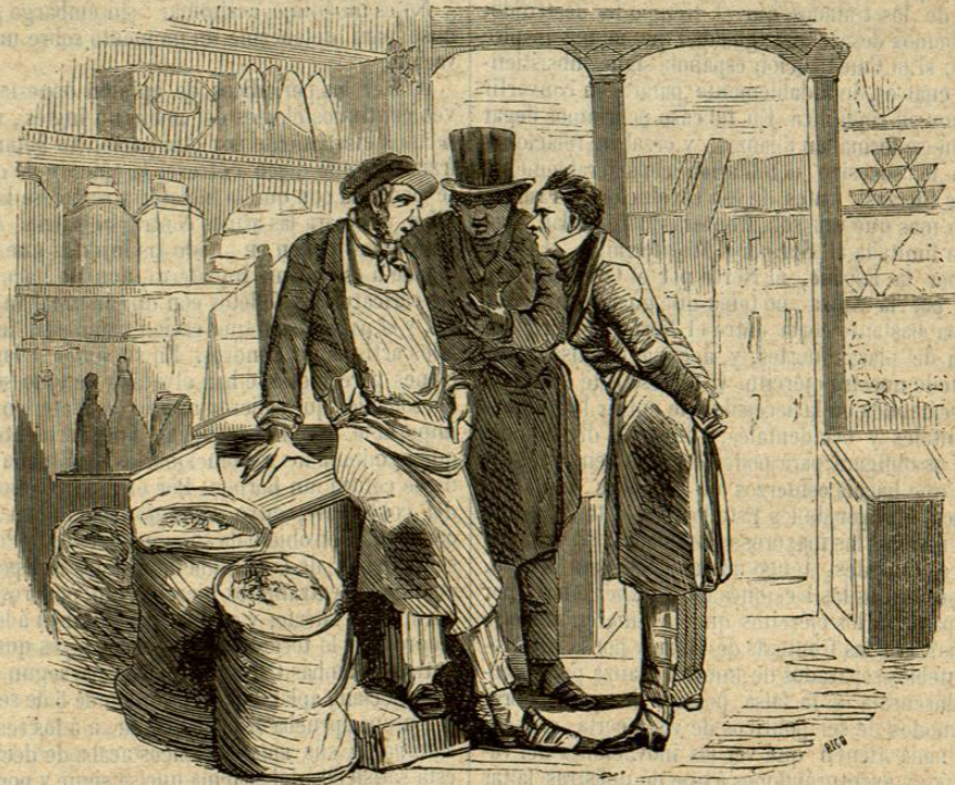
UN PROPAGADOR DE NOTICIAS FALSAS.

Una nota dirigida en 11 de enero último al encar-