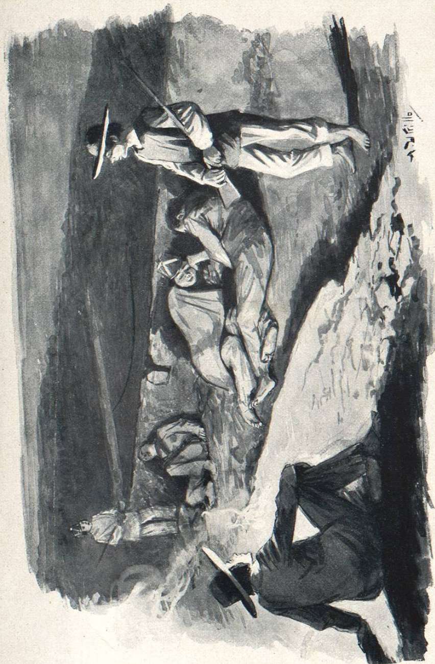
Por la noche durmieron ya arma al brazo...