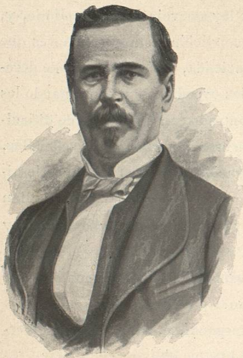
D. FÉLIX ZULOAGA

— Lo que yo puedo decir á usted, respondió Zuloaga,