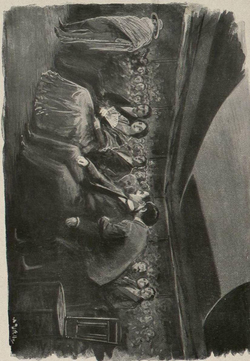
— ¿Ves, me dijo, aquel charro embozado hasta los ojos...

Cuando empezó el entreacto hablamos con disimulo á diez ó doce vecinos de los comprometidos, y nos marcha-