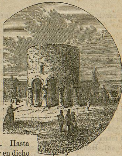
TORRE DE PIEDRA EN NEWPORT.

129. En 1641, los pequeños establecimientos de Nuevo Hampshire pidieron que se les admitiese en la colonia de la Bahía de Massachusetts. Concedióse su peticion, y continuó la union hasta 1680, en cuya época fueron separados por el rey, y volvió á ser una provincia independiente con el nombre de Nueva Hampshire.