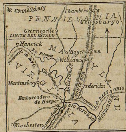
TEATRO DE LAS INVASIONES DE LEE.

Esta ventaja fué mas que suficientemente contrarrestada al día siguiente con la pérdida de Harper's Ferry, y su guarnicion, que ascendia á 11,583 hombres, tomado por el General confederado Jackson que habia sido enviado allí ántes de la batalla de South Mountain. Al otro día se juntó Jackson con Lee, y libraron la gran batalla de Antietam. Las armas de la Union ganaron allí otra victoria; pero las