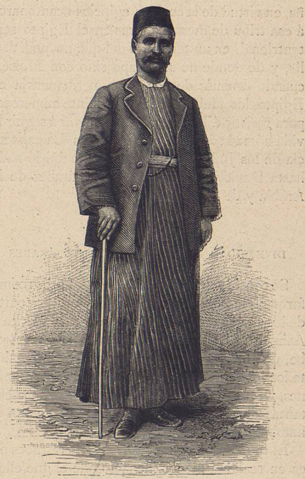
Arabe sedentario de Siria, fotografiado en Damasco por el autor

mos siglos há, ramplón casi siempre, y pusilánime, avaro y codicioso; de manera que parece humillante para el primero verse comparado con el segundo. Pero téngase presente que depende de las condiciones particulares de existencia que ha debido pasar desde hace siglos el Judío, lo que le ha transformado en la despreciada raza que hoy conocemos; pues todo pueblo sometido