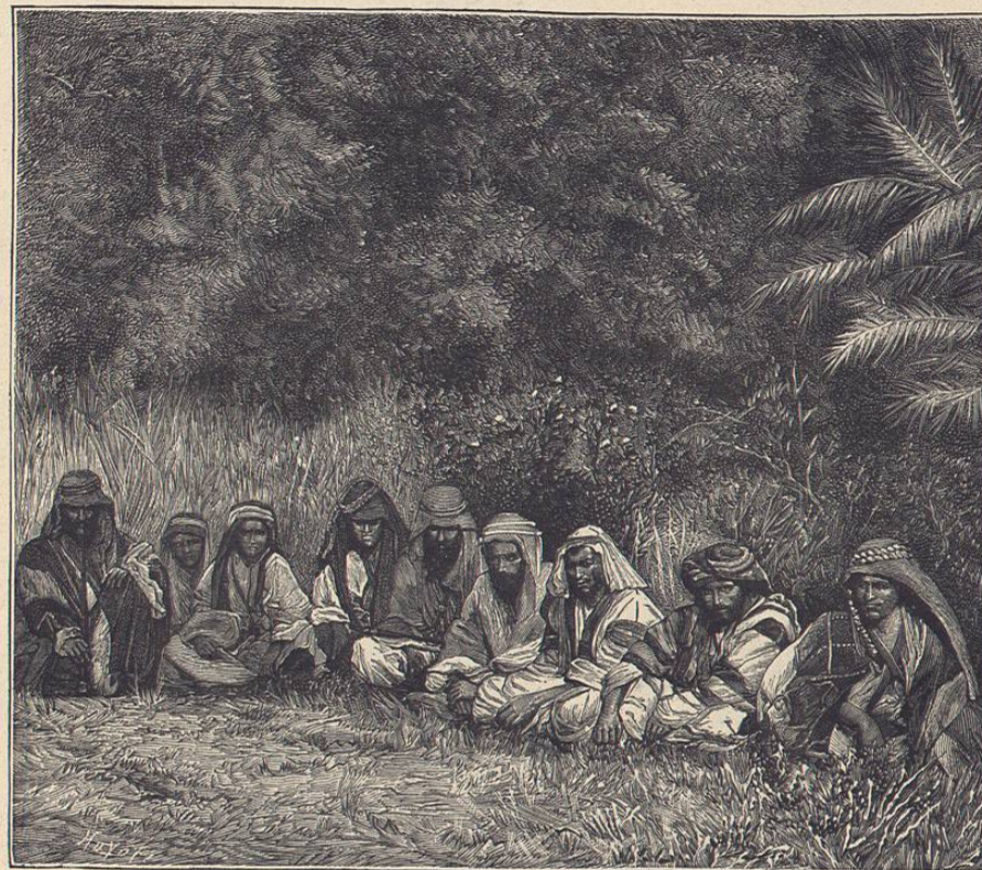
Beduinos nómadas de Siria, fotografiados en Jericó por el autor

raza, y esta variedad nos demuestra la causa de que instituciones parecidas, aplicadas á distintos pueblos, produzcan resultados tan diferentes como, por ejemplo, la causa de la miserable anarquía de las repúblicas españolas de América, comparada con la prosperidad de los habitantes de los Estados Unidos bajo instituciones idénticas. La iniciativa, la previsión, el valor, la aptitud para gobernarse, el dominio sobre sí mismo, etc., etc., sentimientos son que la he-