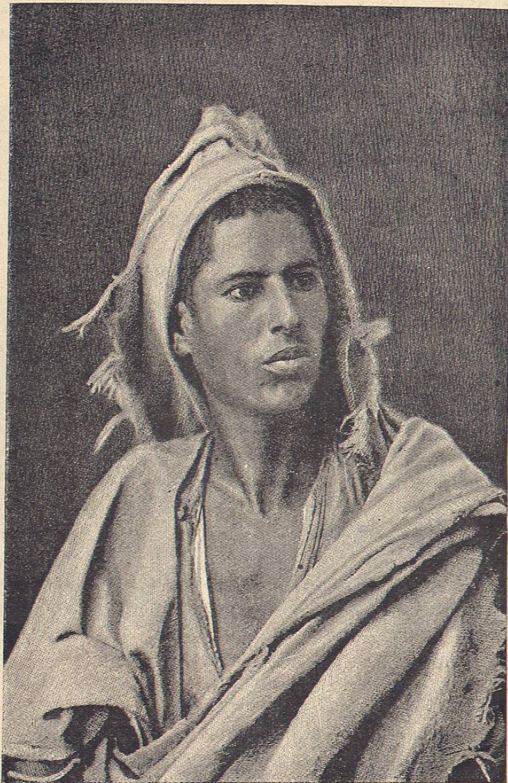
Berberisco de Argelia.—De fotografía

demo suponer que hallaremos también identidad en el modo de pensar y proceder. El berberisco sedentario es como el árabe sedentario, un trabajador denodado, un hombre dotado de la mayor paciencia, y enérgico é industrioso. Y el berberisco nómada es como el árabe nómada, independiente, belicoso, sobrio y capaz de