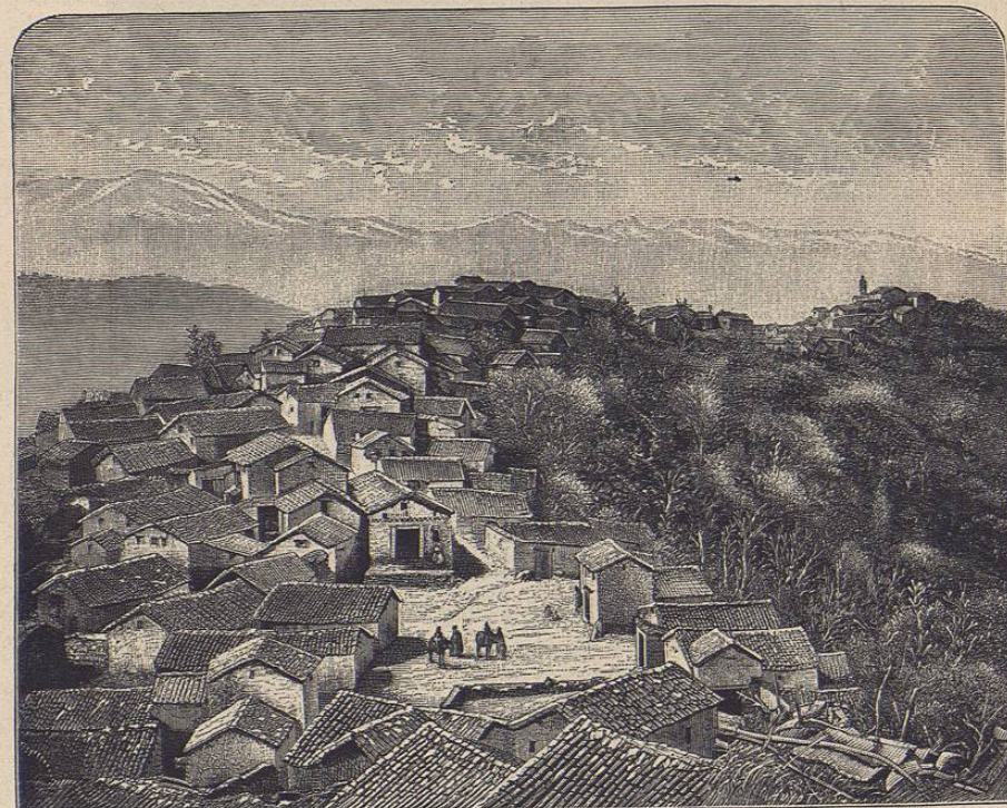
Aldea berberisca.—De fotografía

Los Berberiscos son monógamos; pero aunque sus mujeres disfruten de más libertad que las de los pueblos cristianos, tienen muy pocos derechos.