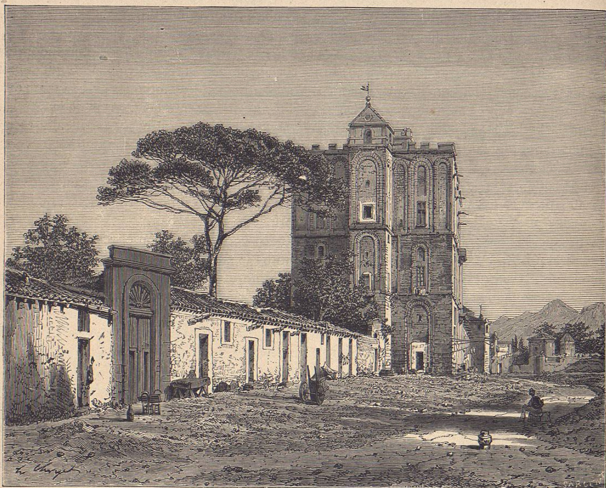
Vista de la Zisa cerca de Palermo

Cuando los Normandos conquistaron la Sicilia, la civilización de los Arabes era ya muy floreciente; y como Roger y sus sucesores tuvieron el buen sentido de comprender la supe-