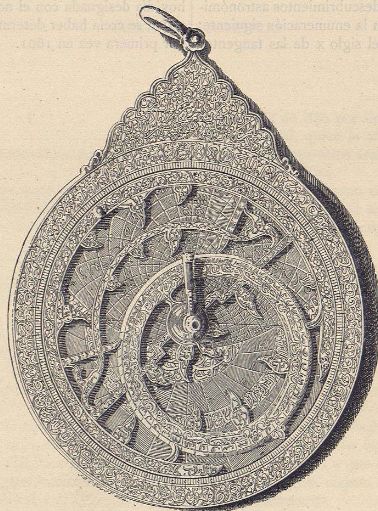
Cara posterior del astrolabio representado en la página anterior

Los Arabes observaban los ángulos por medio de cuartos de círculo y de astrolabios; y muchos de estos últimos instrumentos han lle-