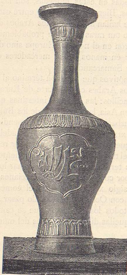
Jarrón de bronce chino-árabe

Diferentes pueblos han sometido al Oriente: tales son los Persas, los Griegos, los Romanos, etc.; pero si su influencia política siempre