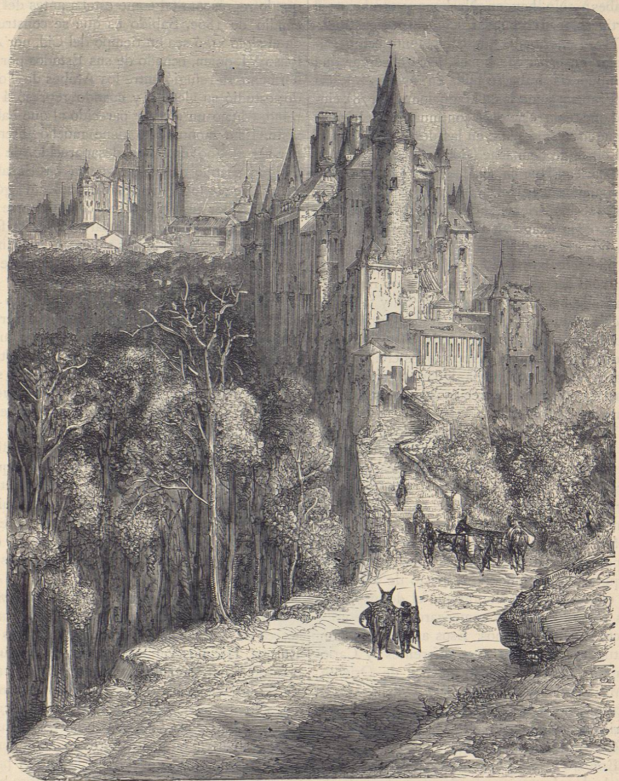
Alcázar de Segovia

tes, y vivían en centros tan poco parecidos, que las artes, simple expresión de las necesidades y sentimientos de una época, no podían menos de diferenciarse pronto.