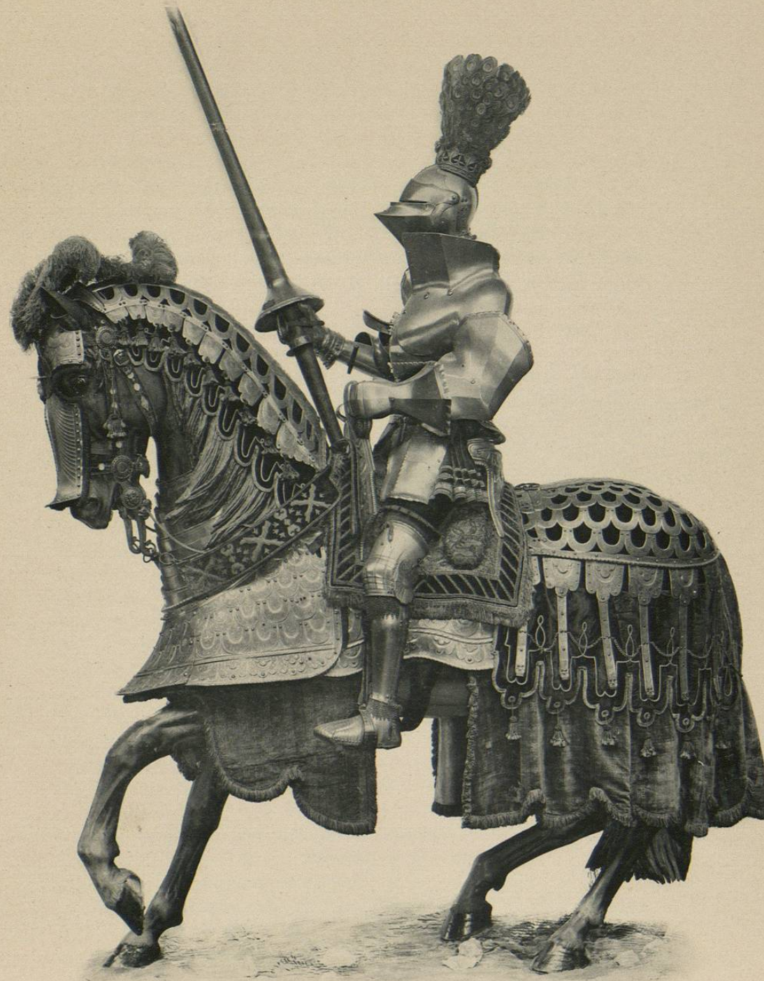
ARNÉS DE JUSTA ECUESTRE DE CARLOS V