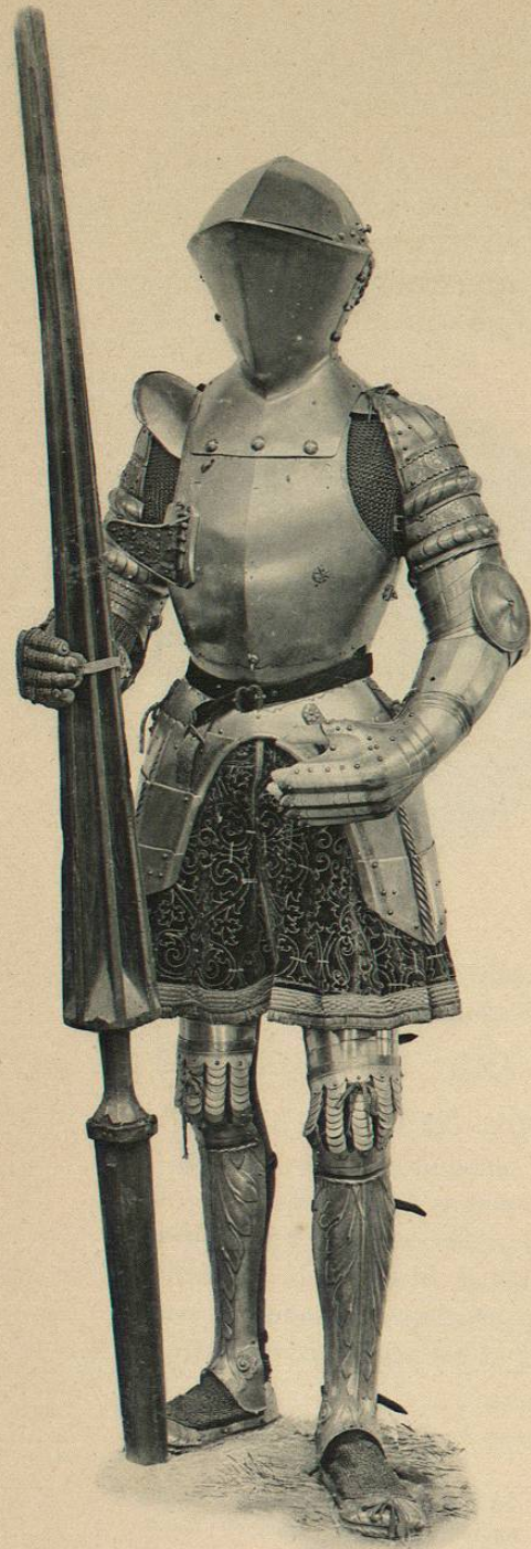
ARNÉS DE JUSTA REAL DE CARLOS V.