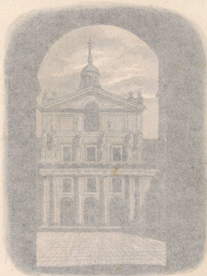
Fachada del templo del Exorcisat