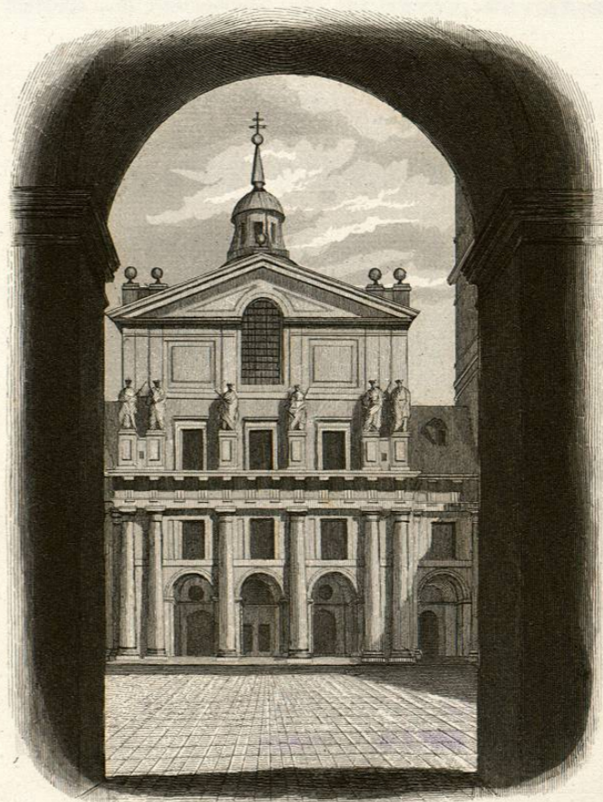
Fachada del templo del Escorial.