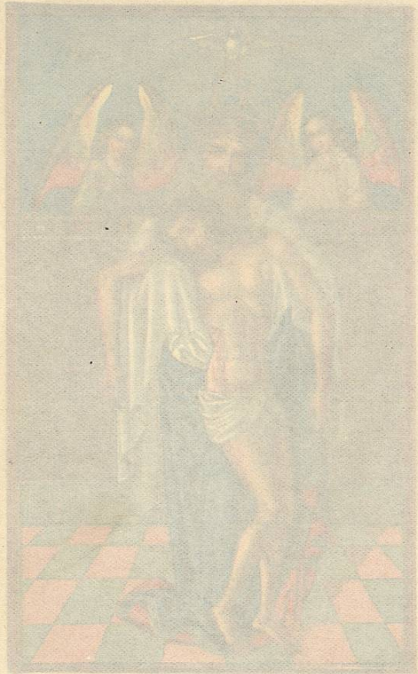
Fr. Pustet, Ratisbonae, Roma et Neo Eboraci. L. No. 1.