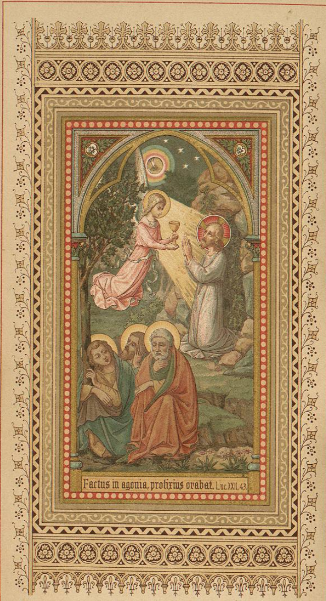
Factus in agonia, profusus orabat. Luc. XXII. 43