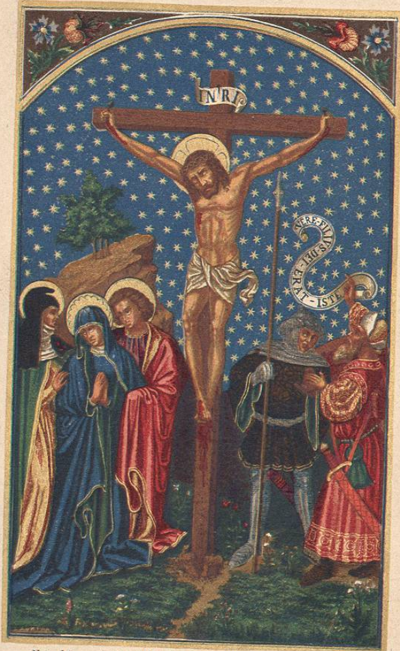
Nro. 14. Sumptibus FR. PUSTET, Ratisbonæ. XIX. Deposé.