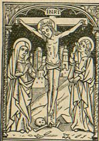
Foderunt manus meas et pedes meos

Indulg. plen. Defunct. applicabil., si hæc Oratio dicitur post Comm. sacram coram imagine Crucifixi, et oretur per aliquod tempus ad intent. S. P. (SS. PP. Pius VII. etc. ac Pius IX.)