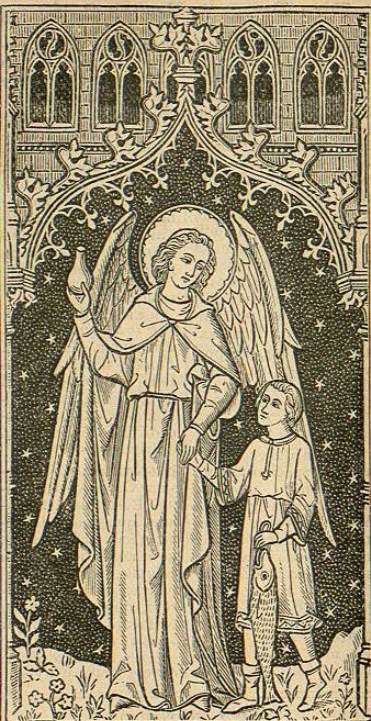
Sancte Raphael Archangele.