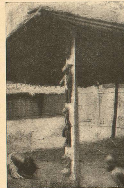
FÉTICHES DU KWANGO (AFRIQUE). « Au lieu des ridicules fétiches, offrez aux pauvres Noirs le crucifix. »

cinquante millions d'indigènes sont victimes de ces superstitions puérides. Jeunes apôtres, allez au fond de ces déserts, allez détrôner ce sachet rempli de terre et rougi du sang d'un coq, qu'ils prennent pour une divinité tutélaire ; à la place du fétiche éventré sous les yeux réjouis des pauvres noirs, vous placerez le crucifix.