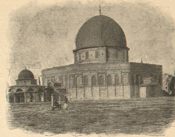
LA MOSQUÉE D'OMAR A JÉRUSALEM. « A la place du croissant brisé, jeunes apôtres, sur la coupole arbores le crucifix. »

Jeunes gens, qui, peut-être, gaspillez en France l'énergie de vos vingt ans, que ne courez-vous au pays de l'Islam, que n'allez-vous abattre le croissant maudit, et arborer le crucifix au sommet de la coupole !