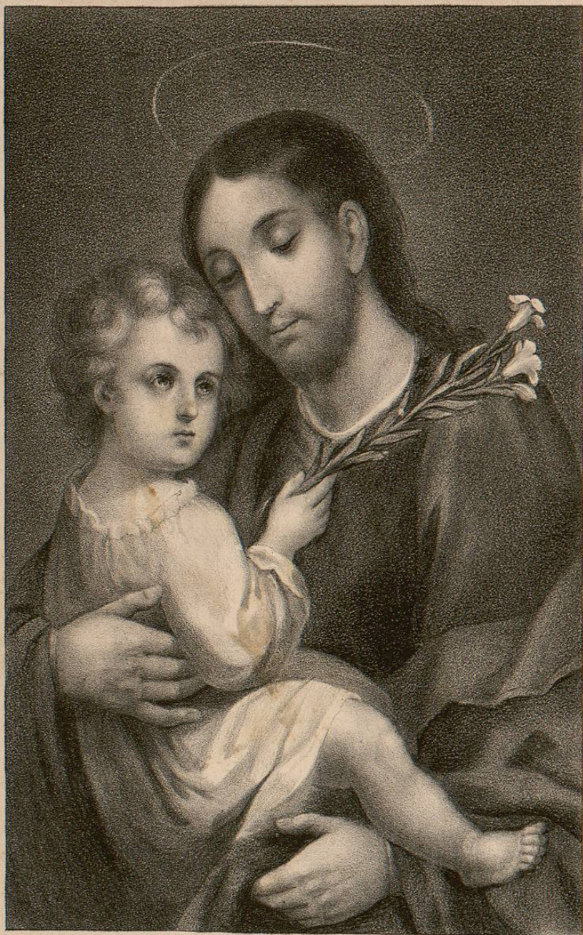
EL SMO. PATRIARCA SEÑOR SAN JOSÉ