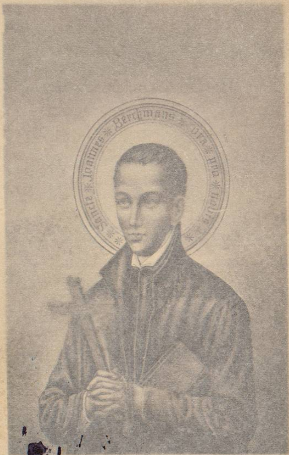
SAN JUAN BERCHMANS. S. J.